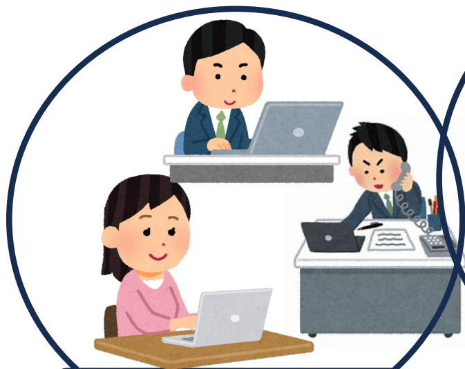
システムエンジニアリング (SE)